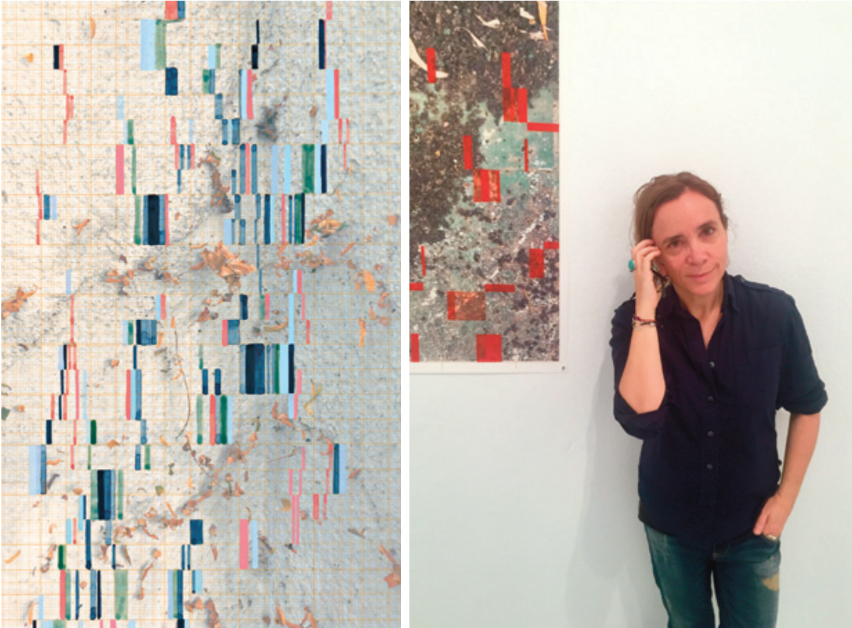
A la izquierda Jardines-5. Las Palmas de GC . A la derecha: la artista ante otra de las piezas de la serie Diario de Ida .